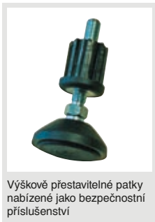
Výškově přestavitelné patky nabízené jako bezpečnostní příslušenství